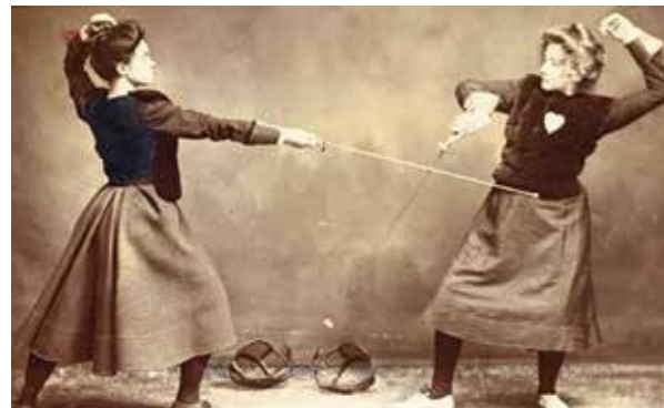
Fechtmode um 1900