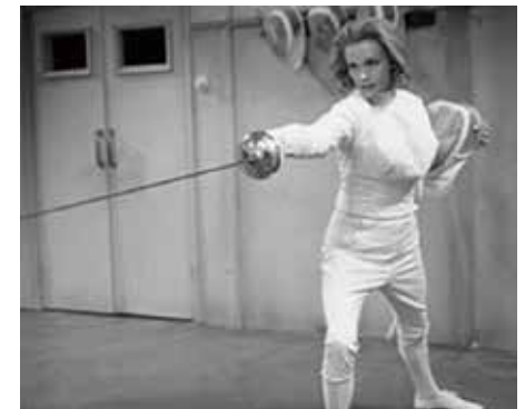
Mode von 1961