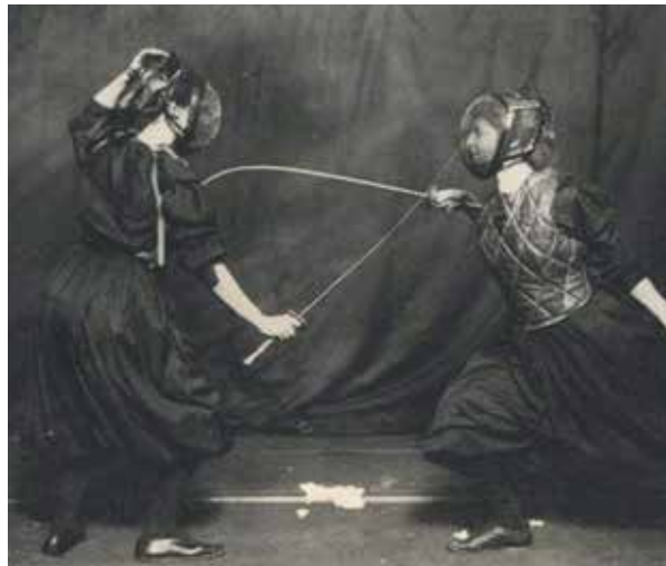
Mode im Fechtsport um 1908