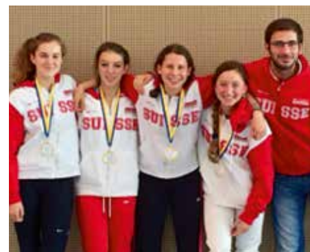
ECC-EDC Florimont Genf