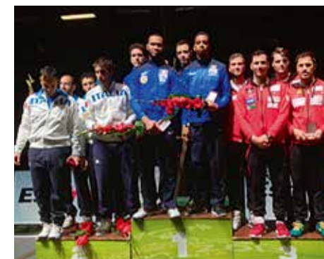
WC EHS Tallin Mannschaften