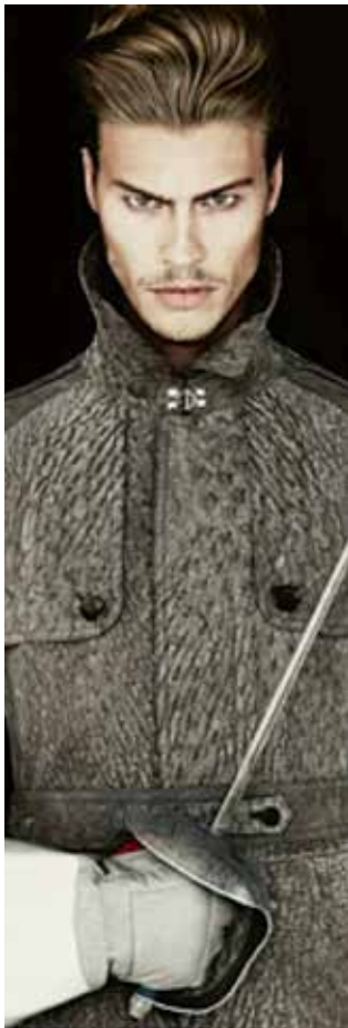
Designed by Thomas Vording