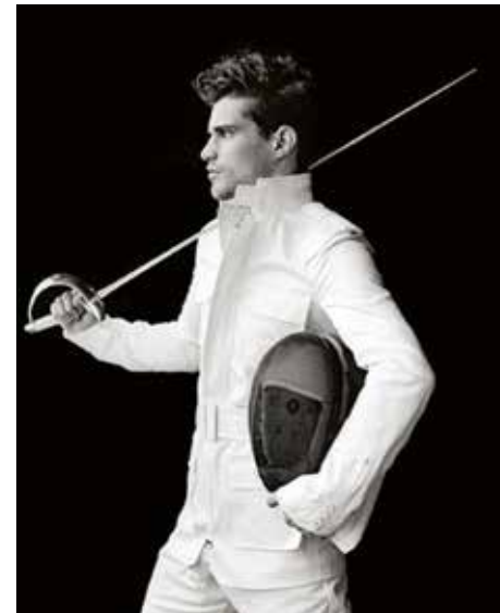
Design by Dayenne Bekker